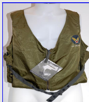
Corpetto E-1 Vest Made in USA